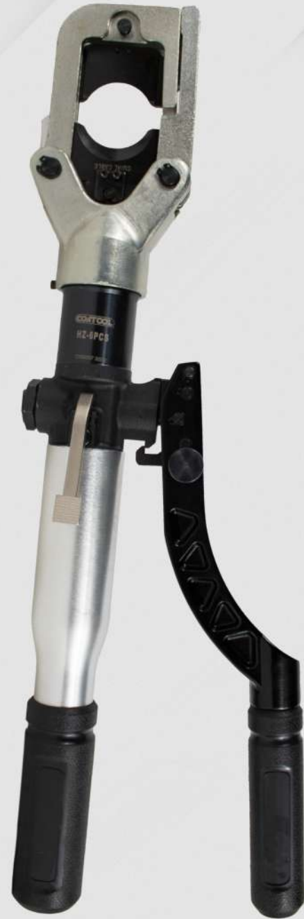
TABLA DE CALIBRES