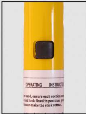
9.2 METROS CON-920P 7 SECCIONES